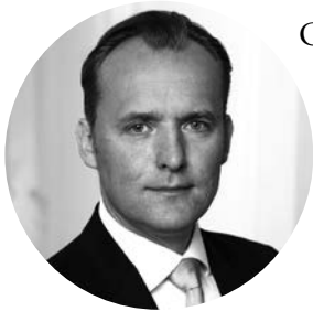
Prof. Thorsten Polleit

Geld, das allgemein akzeptierte Tauschmittel, ist eine großartige Erfindung. Ohne Geld wäre eine moderne Volkswirtschaft nicht durchführbar. Erst das Verwenden von Geld erlaubt eine feingliedrige Arbeitsteilung, die die Ergiebigkeit der Produktion und damit den Wohlstand der Menschen erhöht.